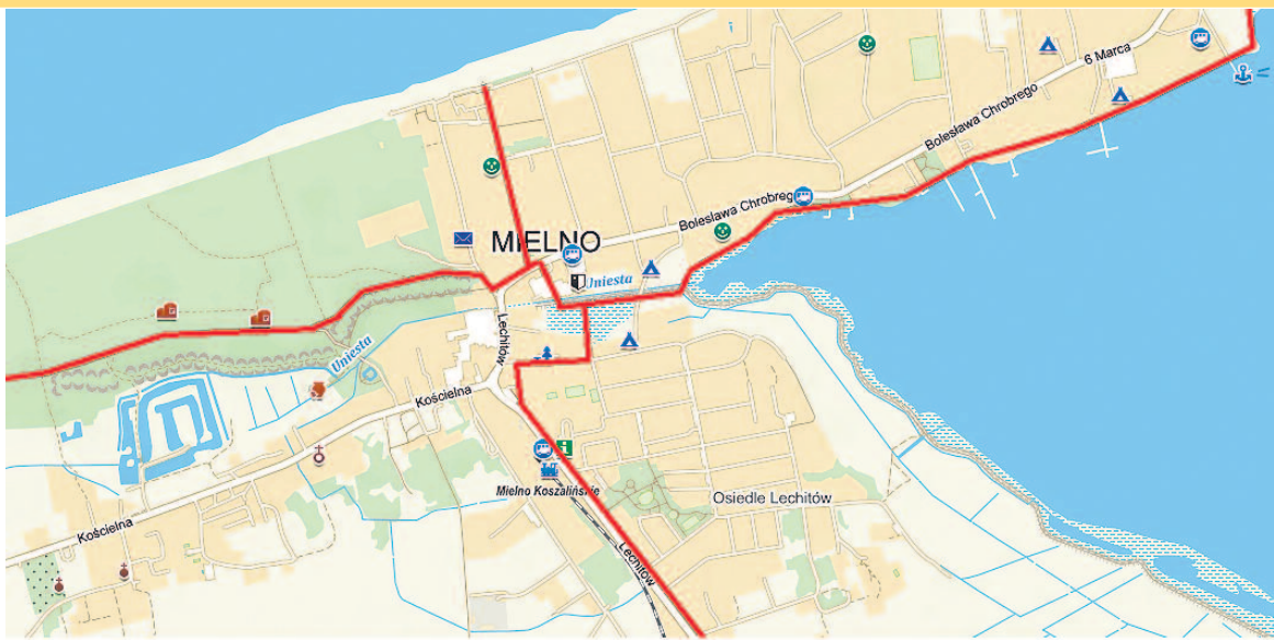
Docelowy przebieg głównych tras rowerowych w centrum Mielna (lato 2021)

Obecnie trwa realizacja trzeciego projektu, którego celem jest wprowadzenie tranzytowego ruchu rowerowego poza główne ulice Mielna. Trasa będzie poprowadzona po wale przeciwpowodziowym wzdłuż południowego brzegu strugi o na-