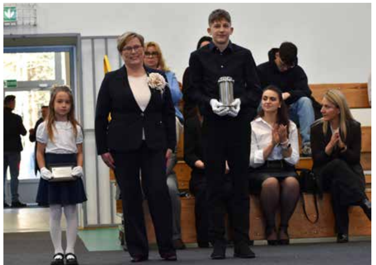
kapsuła czasu – tabliczka pamiątkowa z mottem

nach. - Mamy nawet złożony wniosek na dofinansowanie na rozwój szkoły, jeżeli chodzi o dostępność. Bardzo nam zależy na tym, by ta szkoła była dostępna dla wszystkich dzieci, nawet jeśli mają jakieś ograniczenia ruchowe bądź inne - spuentował burmistrz.