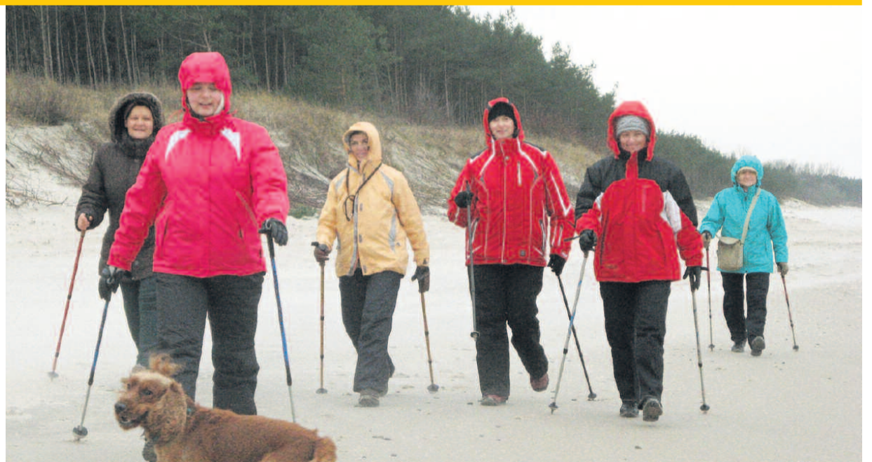
SPOTYKAMY SIĘ W SOBOTY, O GODZINIE 9, PRZY PIERWSZYM WEJŚCIU NA PLAŻĘ OD ULICY 1 MAJA W MIELNIE. DO ZOBACZENIA!

Trener przekonuje, że powinno stać się to stałym elementem naszego życia i świadectwem troski o nasze zdrowie.