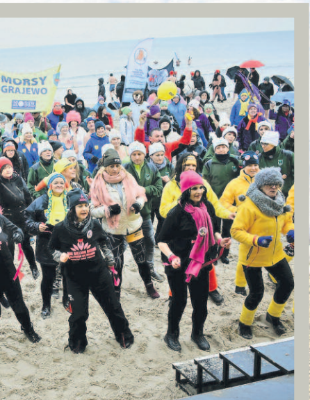
Billion Rising. Uczestnicy XVI Międzynarodowego Złotu Morsów w Mielnie zatańczyli przeciwko przemocy

Mielno po raz kolejny pokazało, że chce to móc i powoli przygotowuje się do kolejnego Złotu. Za rok będziemy bawić się już po raz siedemnasty. Termin Złotu przypada tradycyjnie na drugi weekend lutego (7-9.02.2020), a rejestracja ruszy w listopadzie. Już teraz możecie planować udział w tym wyjątkowym wydarzeniu!