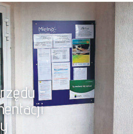
Urzędu - mentacji

Środki gminy będą mogły przeznaczyć m.in. na zatrudnienie nowych pracowników do realizacji zadania, przyznanie dodatków zadaniowych, zlecenie usługi organizacjom pozarządowym czy jej zakup od prywatnych podmiotów.