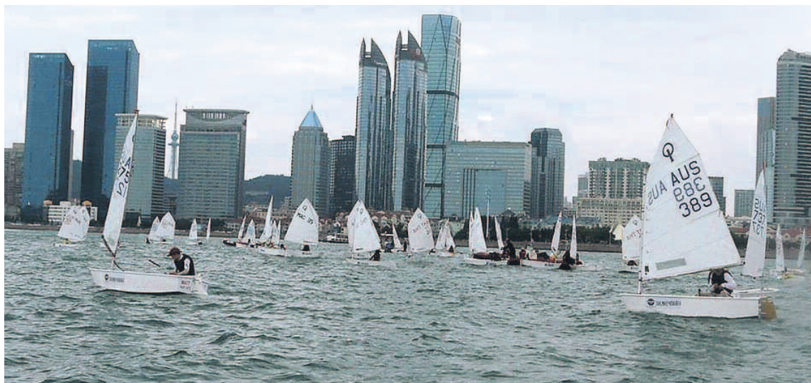
REGATY W CHINACH

– Wspólne plany MUKŻ Bałtyk i ISSA są dość ambitne. W przyszłym roku zaplanowaliśmy wyjazd na obozy i regaty do Chin oraz Danii w ramach Dinghy Skipper Programme. Oczywiście klub z Mielna będzie nadal naszym głównym partnerem w tym programie. Zamierzamy także w ramach podpisanej umowy zaprosić do Mielna młodych żeglarzy z Chin. Planujemy wesprzeć organizację regat na Bornholmie, w Mielnie, i Darłowie w ramach obozów Optimist Baltic Camp. Myślimy nad tym aby Festiwal Żagli ISSA 2018 zorganizować w dwóch lokalizacjach tj. regaty w Klubie Bałtyk, zaś część artystyczno-edukacyjną w centrum miasta Mielna. Cel – aktywnie promować piękny sport jakim jest żeglarstwo. Ponadto uważamy, że warto także pokazać tłumom turystów spędzających wypoczynek w Mielnie, że oferta tego miejsca jest bardzo szeroka, że nie musi być żaru z nieba aby uprawiać sporty wodne. Dodam, że w klubie pojawił się także pomysł, a nawet możliwość pozyskania do użytkowania jachtów morskich. Chcielibyśmy już w przyszłym sezonie zorganizować dla uczniów okolicznych szkół tzw. szkoły pod żaglami i... pójść dalej czyli wprowadzić na stałe do szkolnych programów elementy edukacji żeglarskiej i morskiej.