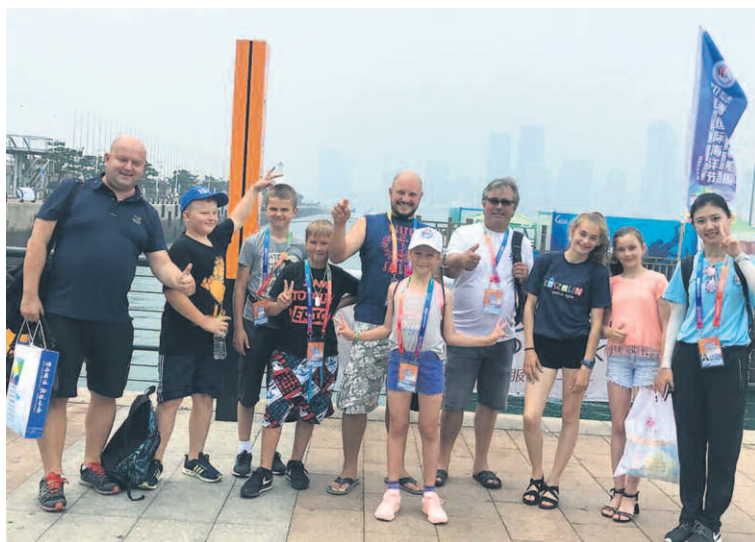
MŁODZI ŻEGLARZE Z OPIEKUNAMI W CHINACH