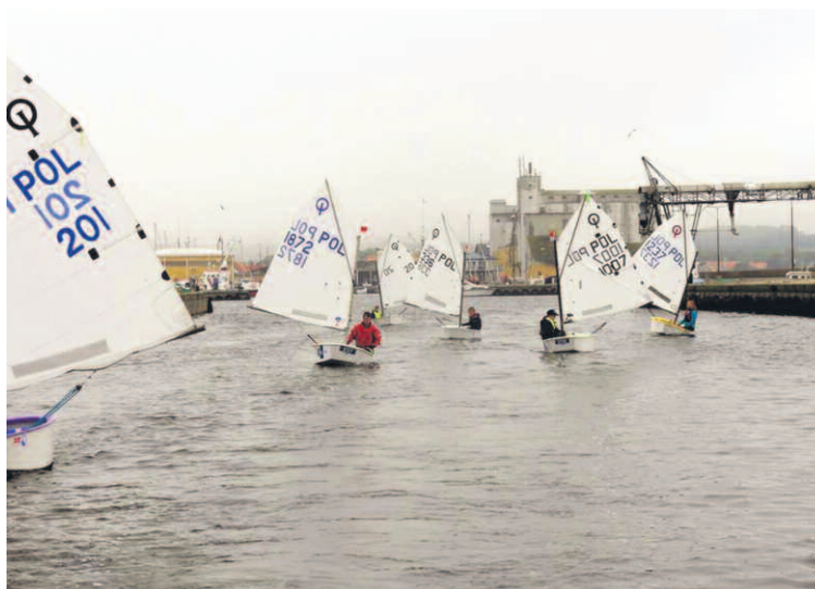
REGATY NA BORNHOLMIE