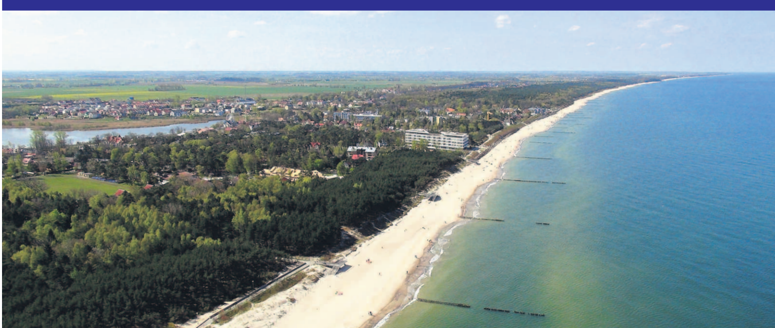
MIELNO – MIASTO POŁOŻONE MIĘDZY BRZEGAMI BAŁTYKU I JEZ. JAMNO.

Od 1 stycznia 2017 roku Mielno zostanie miastem. Taką decyzję na posiedzeniu dnia 19 lipca podjęła Rada Ministrów.