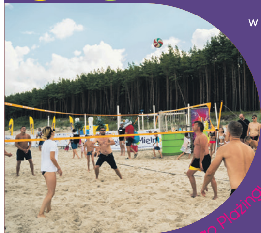
Strefa Aktywnego Plażingu

Kino na Leżakach 22:00 OW Bałtyk przy ul. Leśnej 20 w Łazach film pt. „8 rzeczy, których nie wiecie o facetach”