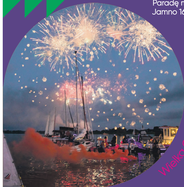
Wielka Gala Żagli