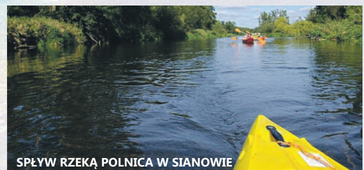
SPŁYW RZĘKĄ POLNICA W SIANOWIE

Koszt biletu: 55 zł, terminy: w każdy czwartek przez okres wakacji (lipiec-sierpień)