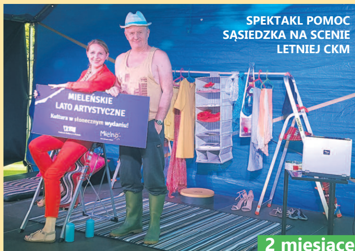
SPEKTAKL POMOC SĄSIEDZKA NA SCENIE LETNIEJ CKM