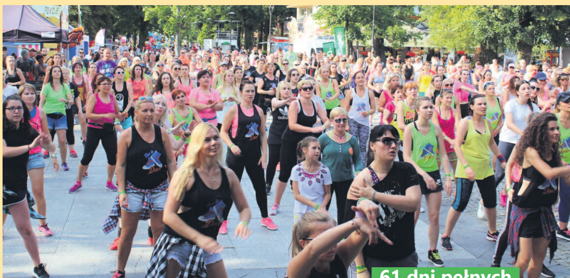
MARATON ZUMBY NA DEPTAKU W MIELNIE

57 imprez: koncertów, przedstawień, kabaretów, festynów, jarmarków