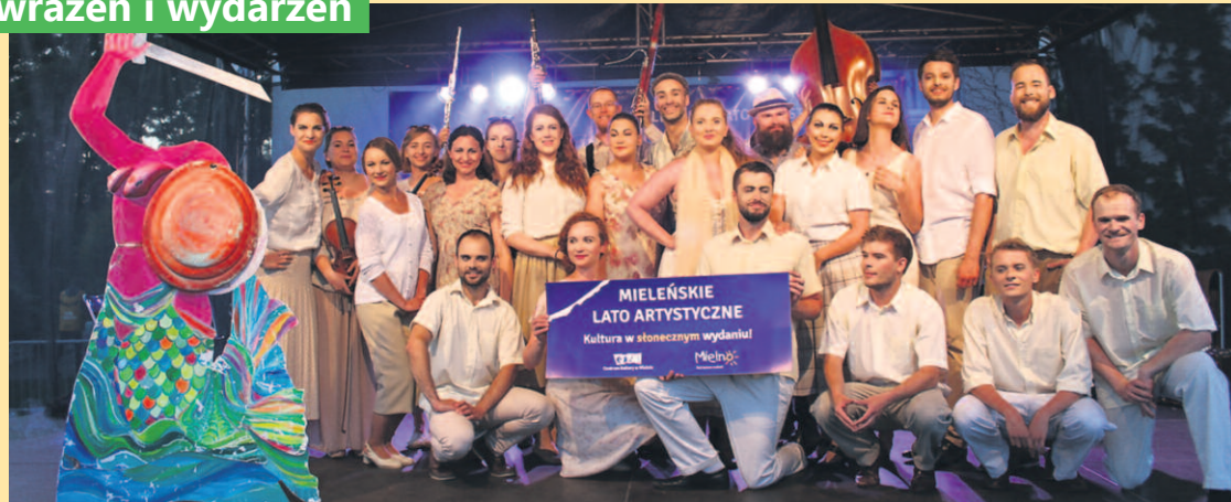
TEATR PIJANA SYPIALNIA ZE SPEKTAKLEM WODEWIL WARSZAWSKI