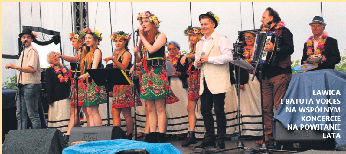
ŁAWICA I BATUTA VOICES NA WSPÓLNYM KONCERCIE NA POWITANIE LATA