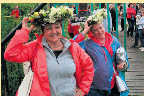
TAKIE WIANKI WITO W NOC ŚWIĘTOJAŃSKĄ W MIELNIE