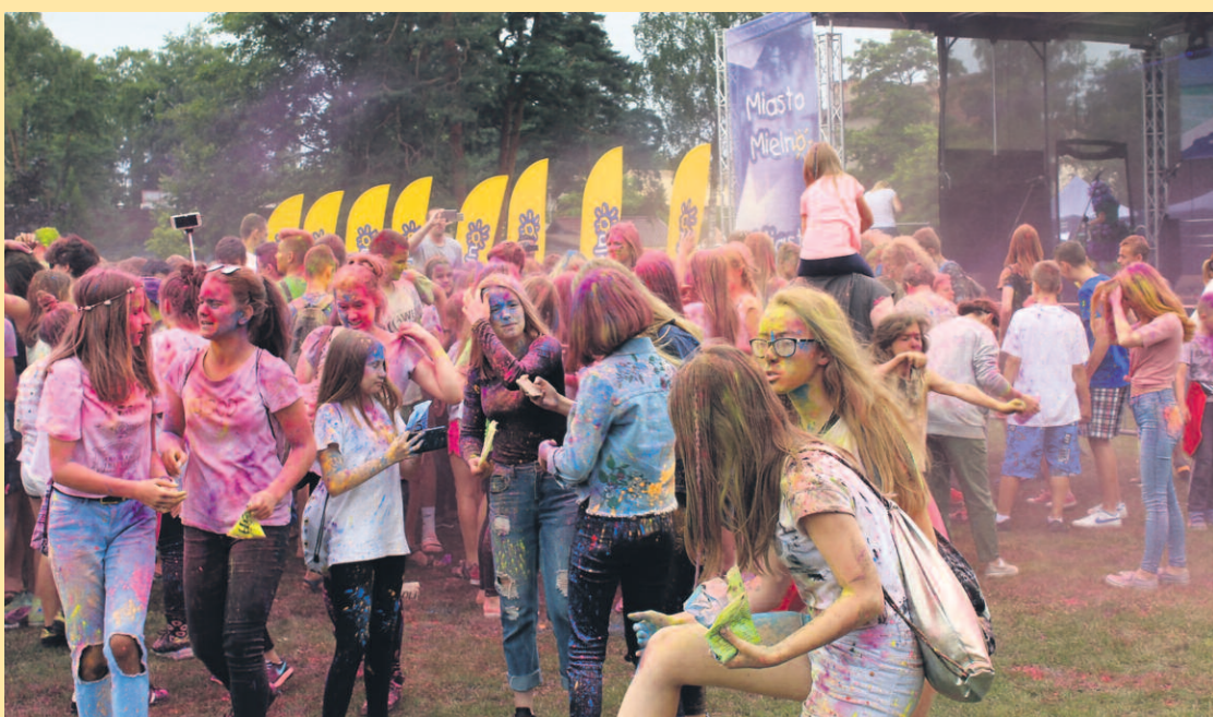
ZABAWA KOLOROWYMI PROSZKAMI HOLI