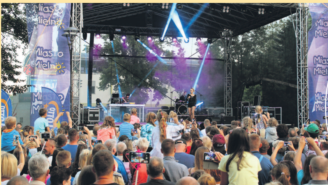
KONCERT CLEO NA MIELEŃSKIM DEPTAKU. TAKICH TŁUMÓW DAWNO W TYM MIEJSCU NIE BYŁO