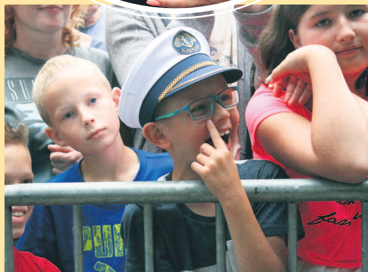
TAKA FAJNA PUBLICZNOŚĆ PODZIWIŁA WYSTĘPY KABARETU NOWAKI