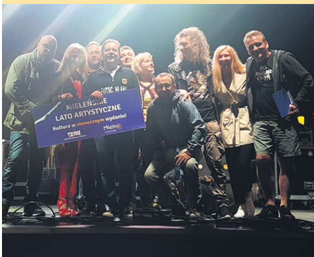
POPARZENI KAWĄ TRZY