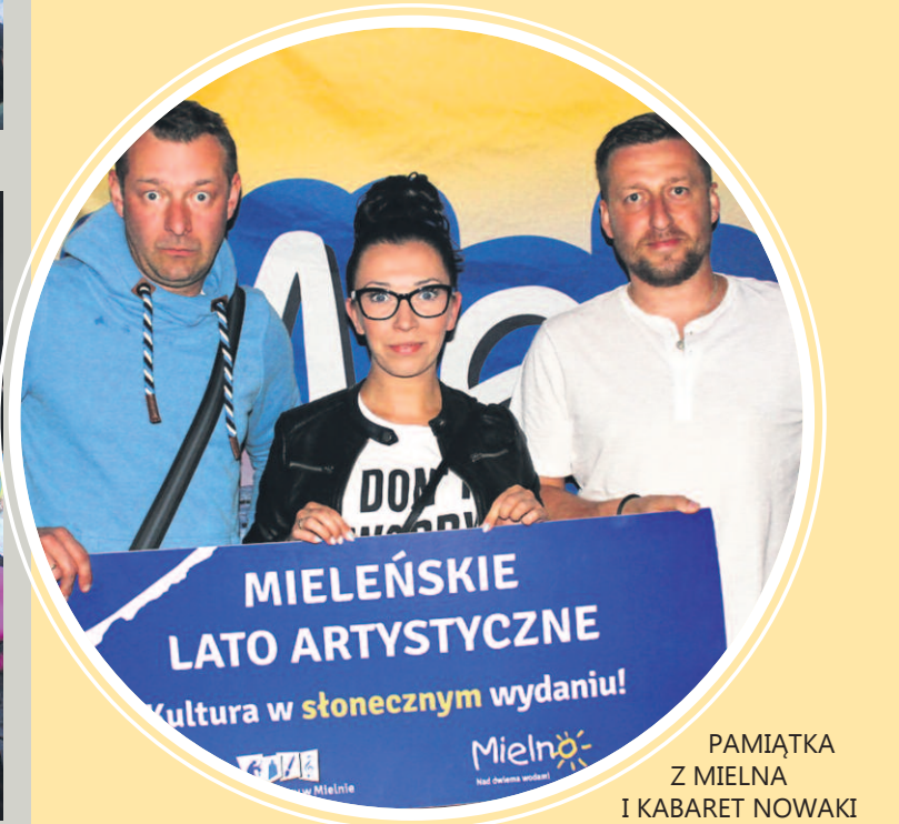
PAMIĄTKA Z MIELNA I KABARET NOWAKI