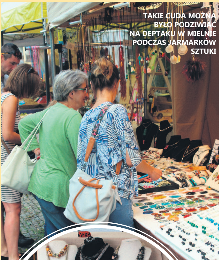
TAKIE CUDA MOŻNA BYŁO PODZIWIĆ NA DEPTAKU W MIELNIE PODCZAS JARMARKÓW SZTUKI