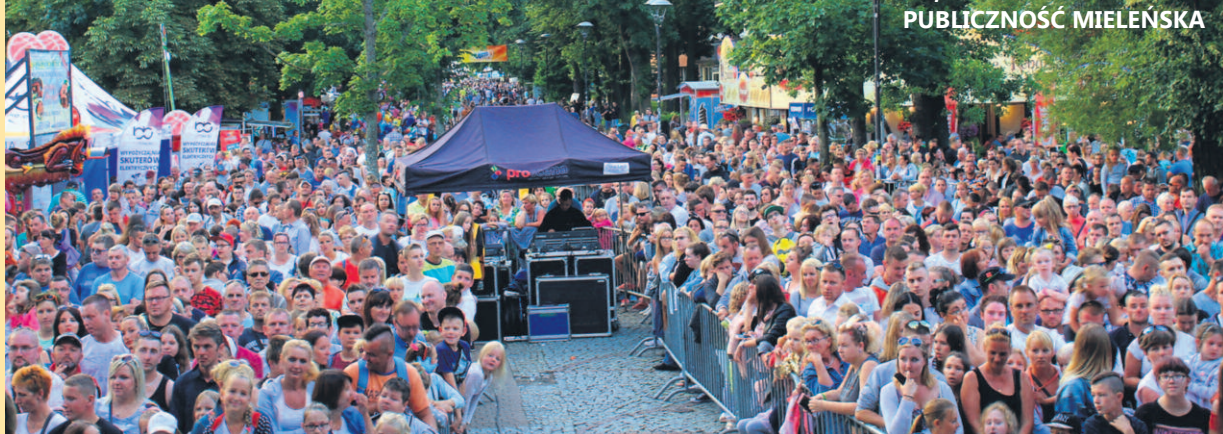
WSPANIAŁA, ODPORNA NA DESZCZ PUBLICZNOŚĆ MIELEŃSKA