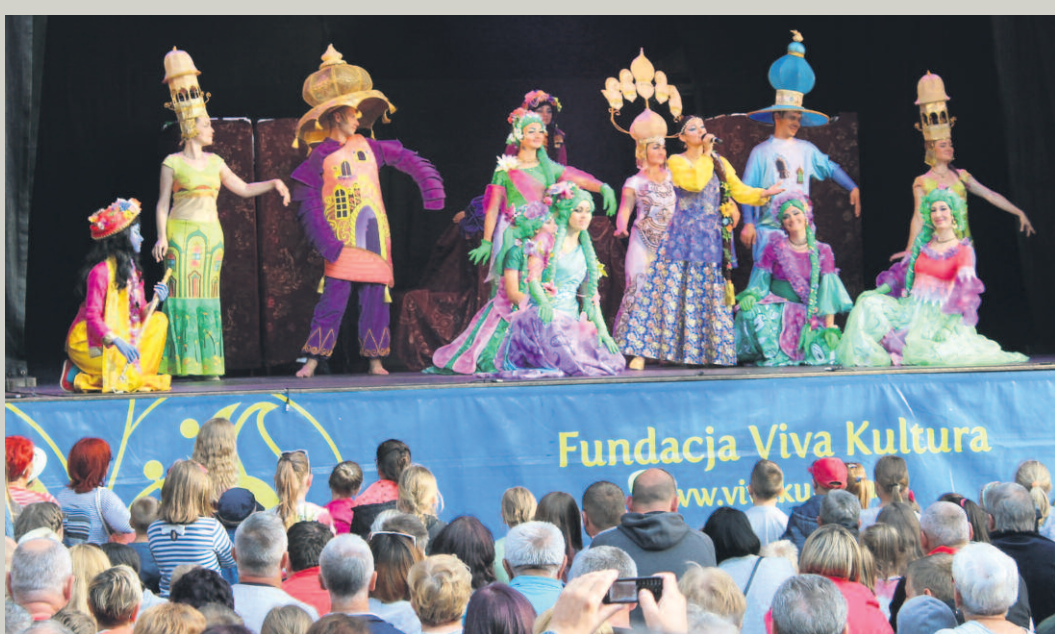
FESTIWAL INDII NA DEPTAKU W MIELNIE