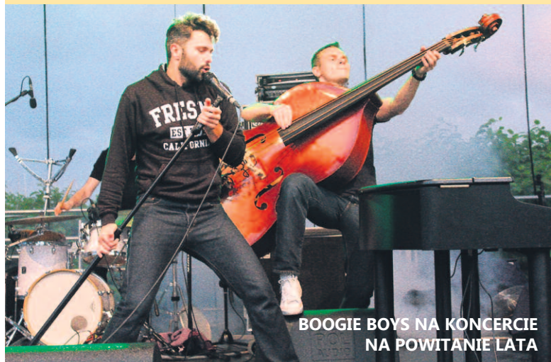
BOOGIE BOYS NA KONCERCIE NA POWITANIE LATA

www.cit.mielno.pl | www.facebook.com/ckmielno