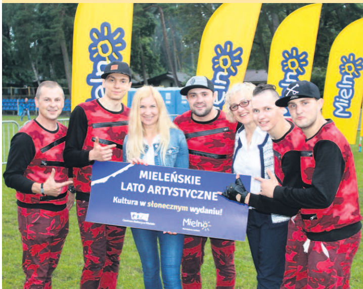
ZESPÓŁ SOLEO PO WYSTĘPIE NA STADIONIE W MIELNIE