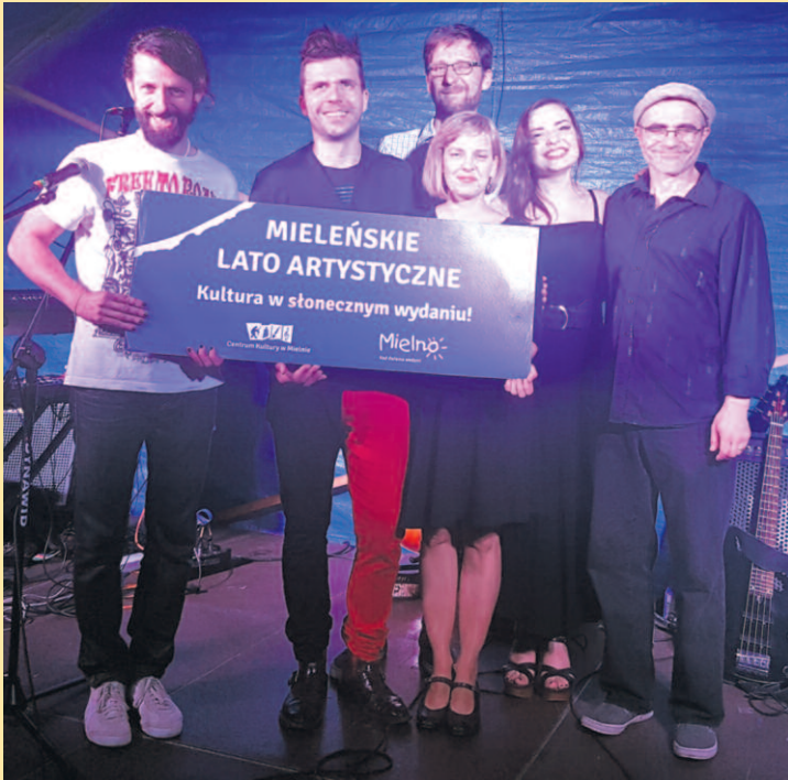
ZESPÓŁ LIMBOSKI PO KONCERCIE NA SCENIE LETNIEJ CKM