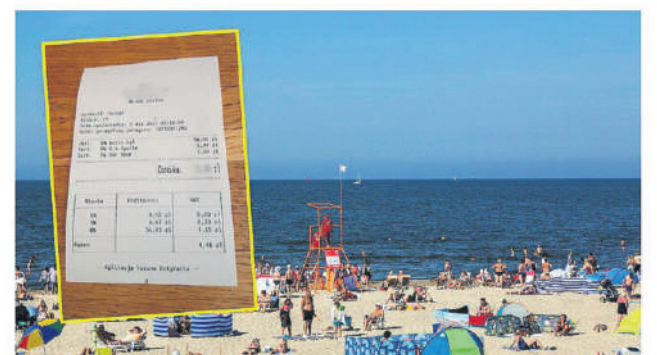
Nasz czytelnik pokazał paragon z Mielna

Festiwal „paragonów grozy” znad polskiego morza trwa. Na szczęście wśród ponurych doniesień o wszędobylskiej drożyznie zdarzają się też „rachunki łagodności”. Czytelnik o2 pokazał, ale zapłacił w restauracji w Mielnie. Można nabrać apetytu!