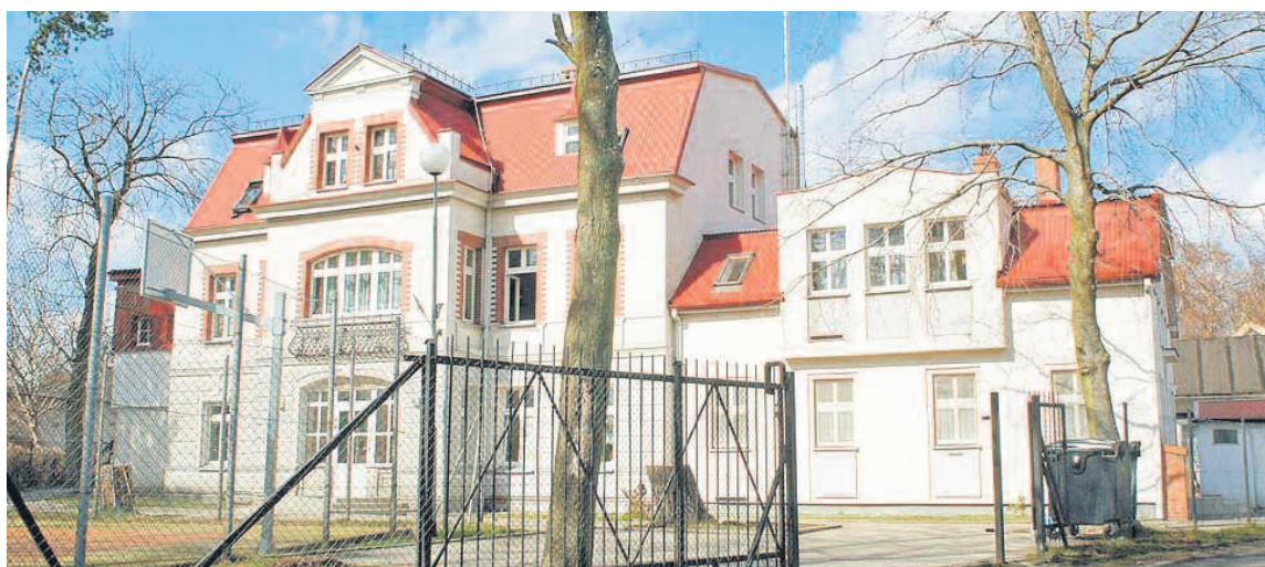
DAWNIEJ W BUDYNKU MIEŚCIŁ SIĘ M.IN. DOM UZDROWISKOWY (KURHAUS), POTEM DOM DZIECKA (DO 2010 R.), PO CZYM PRZEKSZTAŁCONO GO W OBIEKT TURYSTYCZNY „WODNIK”.

Jednak sam budynek, nad którym czuwa konserwator zabytków, wymagać będzie szeregu adaptacji i dostosowania do potrzeb działalności Centrum. Bryła zostanie nienaruszona, jednak wewnątrz zaplanowano prawdziwą „rewolucję”. Do końca listopada br. powstanie pro-