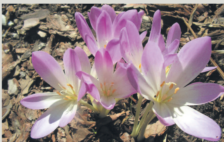
COLCHICUM 'SPARTACUS' (10.09.2015)