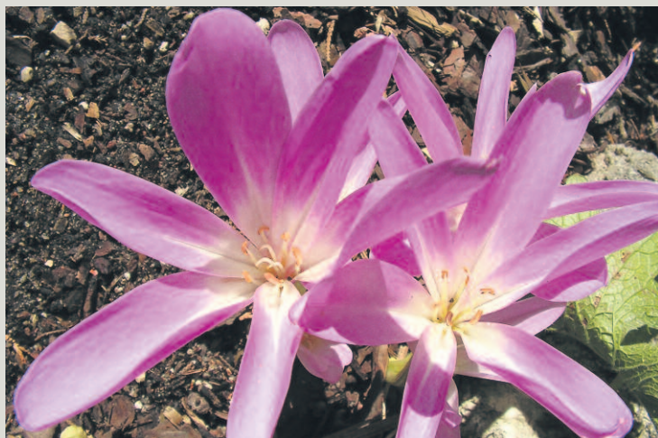
COLCHICUM 'LYSYMACHUS' (1.09.2014)