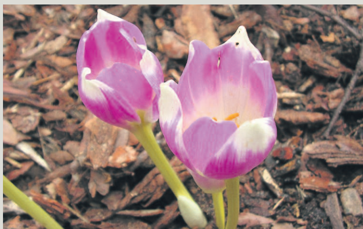
COLCHICUM JANIS RUKSANS (20.09.2016)