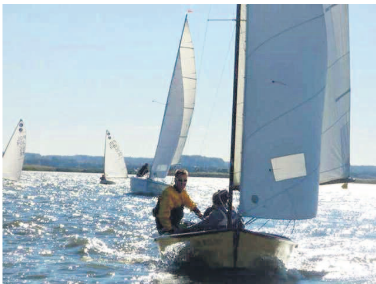
ŻÓŁTA ŻAGŁÓWKA OBSADZONA BYŁA PRZEZ SZKOLNĄ ZAŁOGĘ.

W regatach najwięcej było jednostek kabinowych i parę łodzi klasy