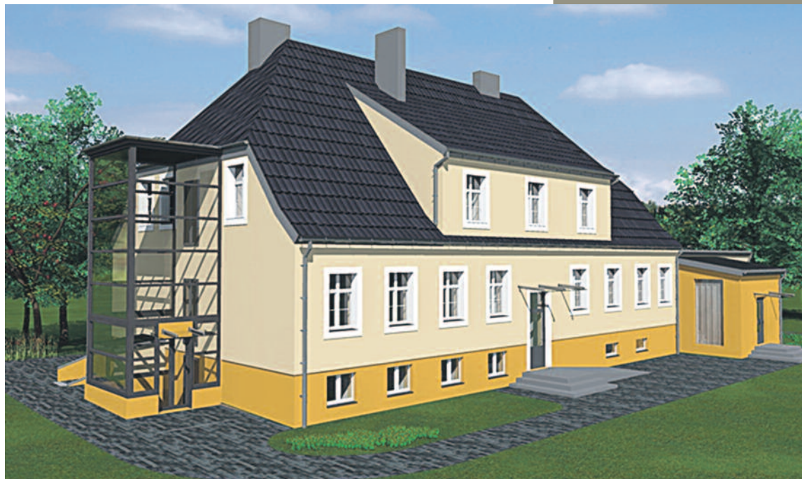
NA ZDJĘCIACH BUDYNEK MOPS (OBECNIE) I WIZUALIZACJA PO PRZEPROWADZENIU TERMOMODERNIZACJI

w tym roku i umowę z wybranym partnerem podpiszemy w grudniu lub w styczniu przyszłego roku - dodaje burmistrz.