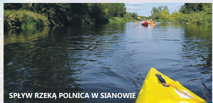
SPŁYW RZEKĄ POLNICA W SIANOWIE

pierwszy raz w kajaku. Podczas spływu można obserwować ptaki wodne (zimorodki, łabędzie, dzikie kaczki, perkozy, kormorany, itp.), pływające zaskrońce, jaszczurki oraz przeróżne, nigdzie niespotykane owady (świtezianki, ważki itp.). Przy dobrej przejrzystości wód można natknąć się na duże ławice ryb. Koszt biletu: 55 zł, terminy: w każdy czwartek przez okres wakacji (lipiec-sierpień).