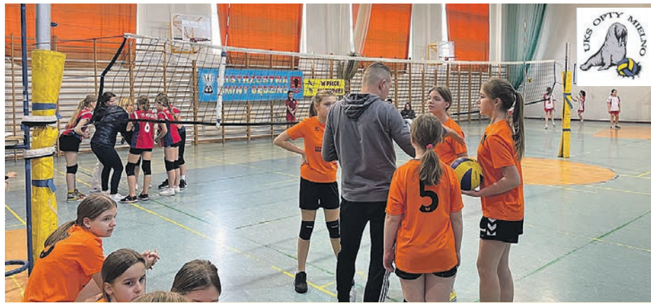
Treningi dla klas III odbywają się we wtorki i środy o godz. 13:40; dla klas IV - V w poniedziałki, wtorki, środy o godz. 14:50 w SP Mielno.

Kolejnym popisem tego zespołu były Mistrzostwa Powiatu Koszalińskiego, w którym dziewczyny uzyskały tytuł mistrza powiatu i tym samym awansowały do dalszych rozgrywek. Warto dodać, że mieleńskie złote zawodniczki zagrały ze starszymi od siebie o rok rywalkami. Trzecioklasistki już od kwietnia będą startować w nowo stworzo-