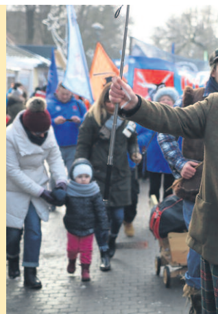
MUZYKA, TANIEC I DOBRA ZAPRAWA PRZEJŚĆ OBOJĘTNIE.