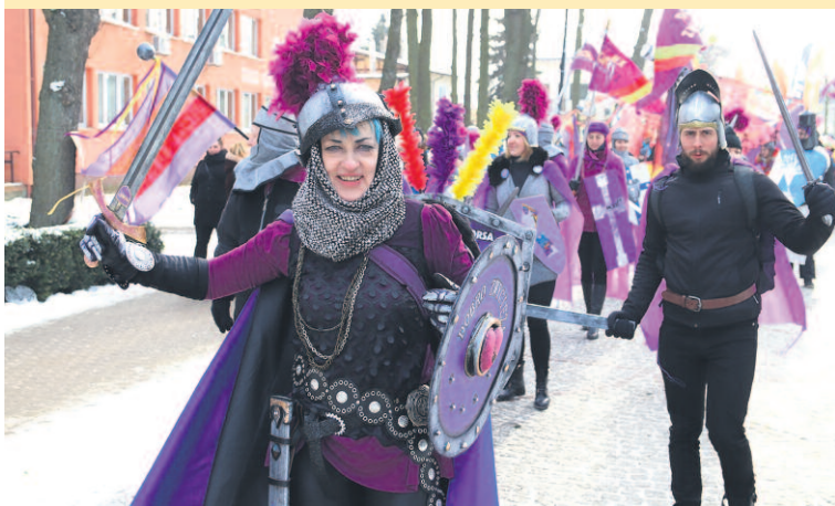
FINAŁOWĄ KĄPIEL POPRZEDZIŁA PARADA MORSÓW ULICAMI MIELNA. NA ZDJĘCIU MORSEX – WROCŁAWSKI KLUB MORSA.