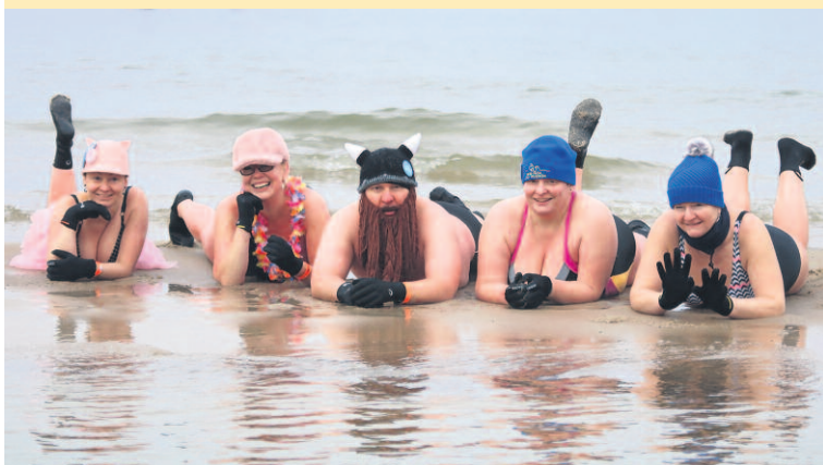
MORSY PRZY TEMPERATURZE POWIETRZA -2°C WSKOCZYŁY DO WODY TYLKO O 4 STOPNIE CIEPLEJSZEJ. JAK WIDAĆ JEDNAK, NIKOMU NIE BYŁO ZIMNO. MOŻNA BYŁO NAWET POPŁAŻOWAĆ!