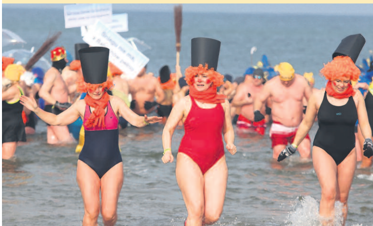
KILKA, CZASEM KILKANAŚCIE MINUT – TYLE NAJCZĘŚCIEJ TRWA MORSOWANIE. ENDORFINY JEDNAK ZOSTAJĄ W ORGANIZMIE ZNACZNIE DŁUŻEJ!