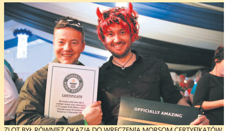
ZŁOT BYŁ RÓWNIEMŻ OKAZJĄ DO WRĘCZENIA MORSOM CERTYFIKATÓW OD GUINNESS WORLD RECORDS. REKORD DOTYCZYŁ NAJWIĘKSZEJ LICZBY KĄPIĄCYCH SIĘ W WIELU MIEJSCACH W TYM SAMYM CZASIE.