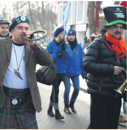
TAŃCZĄCA – OBOK PARADY NIE SPOSÓB