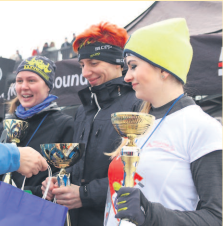
W BIEGU BYŁY PUCHARY OD BURMISTRZA I WICEBURMISTRZA. WYGRANA BYŁA DLA UCZESTNICY Z MIELNA.