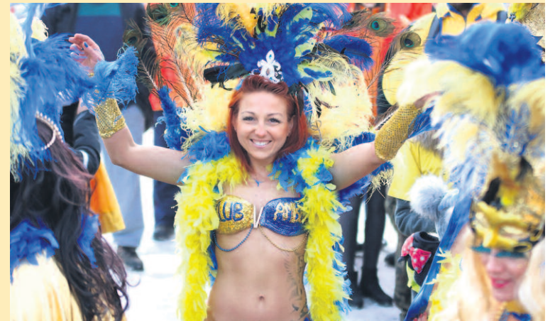
PODZAS NIEDZIELNEJ PARADY MOŻNA BYŁO MOMENTAMI POCZUĆ SIĘ JAK W CZASIE KARNAWAŁU W RIO DE JANEIRO!