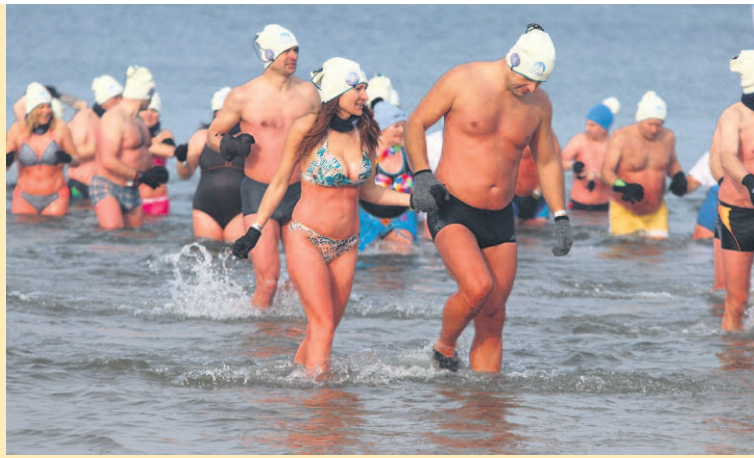
NA ZIMOWĄ KĄPIEL W MORZU WIELU UCZESTNIKÓW CZEKA CAŁY ROK.