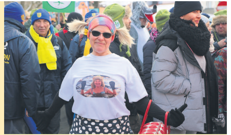
NA ZŁOCIE NIE LICZY SIĘ TO, ILE LAT MAMY, ALE NA ILE SIĘ CZUJEMY. NAJSTARSZY UCZESTNIK MIAŁ 83 LATA, A NAJMŁODSI OKOŁO 2.