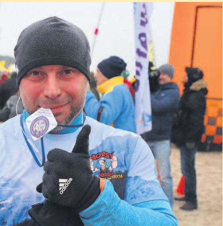
PODŁOŻENIE NA DŁUGIM ODSTANIU 2,5 KM UCZESTNICY OTRZYMAŁI WYDARZENIA. WYDARZENIA BYŁY WYDARZENIA.