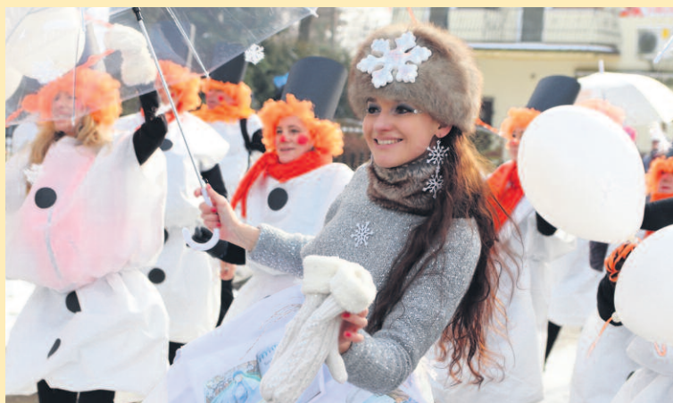
W PARADZIE MORSÓW WZIĘŁY UDZIAŁ MORSY Z PONAD 55 KLUBÓW Z POLSKI I ZAGRANICY.