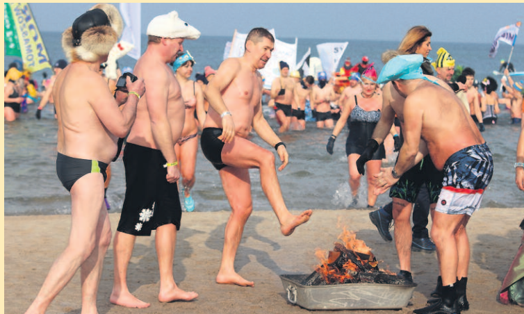
PODZAS FINAŁOWEJ KĄPIELI DO BAŁTYKU WESZŁO 3212 OSÓB! ATMOSFERA BYŁA GORĄCA, ALE DODATKOWE ŹRÓDŁO CIEPŁA TEŻ SIĘ POJAWIŁO...