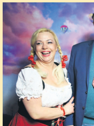
SOBOTNI WIELKI BAL MORSOWY W MIELNIE. WYKONCEROWAŁ ZYGMUNT CHAJZER.