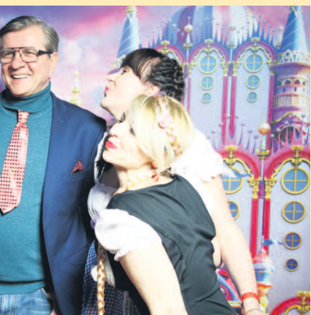
BYŁO WYDARZENIE WYDARZENIA. WYDARZENIE BYŁO WYDARZENIE.