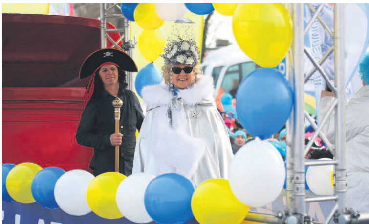
BURMISTRZ MIELNA W ROLI KRÓLOWEJ ŚNIEGU I KRÓL SOBOTNIEGO BALU RÓWNIEŻ WZIĘLI UDZIAŁ W PARADZIE