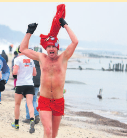
BYŁO DWA BIEGI DLA MORSÓW. JEDEN NA DŁUGOŚCI 5 KM, OBA NA PLAŻY.