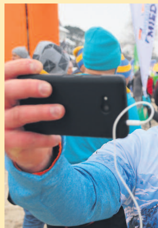
PO UKOŃCZENIU BIEGU NA MORSOWANIE MYWALI MEDALE Z LOGO ZŁOTU