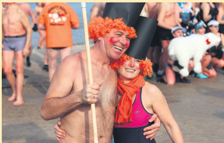
POZYTYWNE NASTAWIENIE TO PIERWSZY KROK, BY PRZEŁAMAĆ STRACH I WEJŚĆ DO WODY.