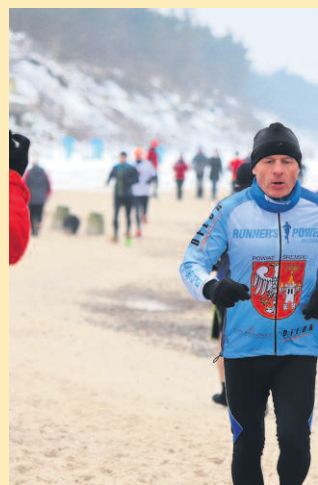
PODCZAS ZŁOTU ODBYŁY SIĘ KLUBOWY BIEG NA MORSOWANIE. DYSTANSIE 2,5 KM, A DRUGI