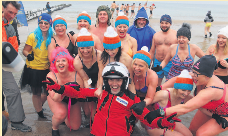
CHCIELI OCHRONĄ ZŁOTU ZAJMOWAŁO SIĘ PONAD 150 OSÓB. BYŁO NIE TYLKO BEZPIECZNIE, ALE TEŻ WESOŁO!