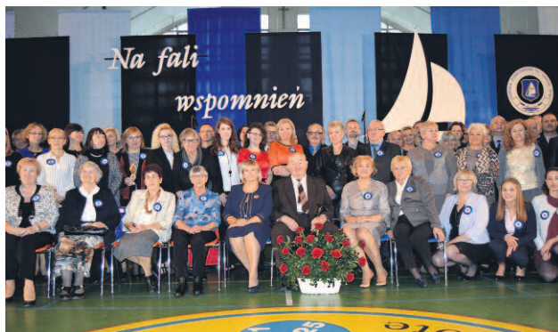
JUBILEUSZ 70-LECIA ISTNIENIA SZKOŁY PODSTAWOWEJ W MIELNIE.