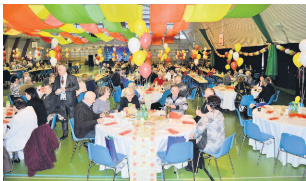
NOWOROCZNE SPOTKANIE BURMISTRZA MIELNA Z SENIORAMI.