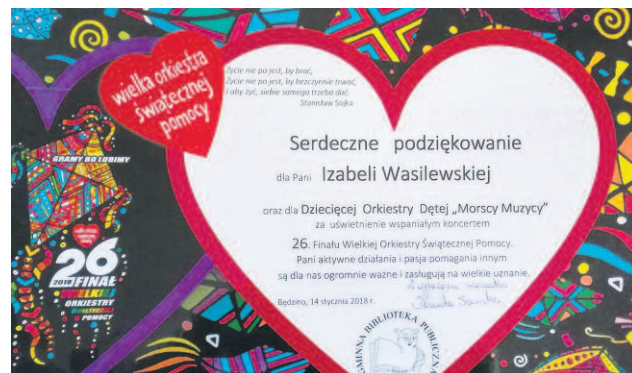
WIELKA ORKIESTRA ŚWIĄTECZNEJ POMOCY.