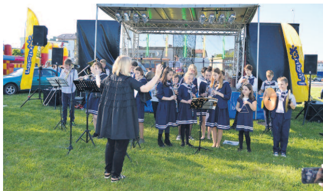
FESTYN NGO – MŁODZIEŻOWA OKIESTRA DĘTA MORSY MUZYCY Z SARBINOWA.