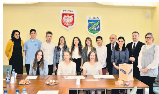
MŁODZIEŻOWA RADA GMINY MIELNO – MŁODZI AKTYWNI RADNI.